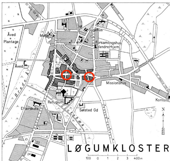
Storegade 12 og Søndergade 0 i Løgumkloster