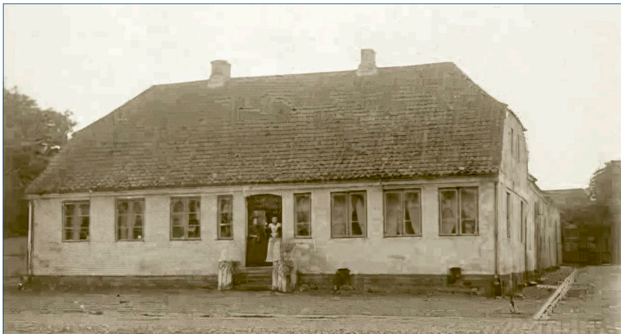
Storegade 12, i Løgumkloster ca. år 1900 - få år før Landbohjemmet blev bygget der.